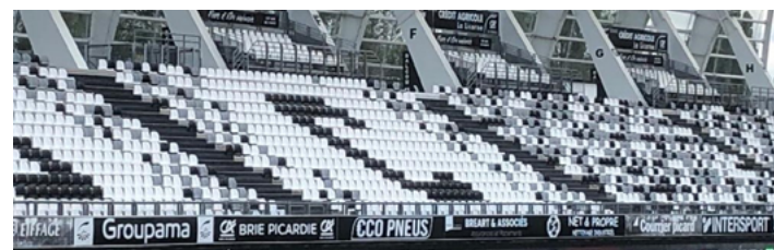
(exemple d'un stade au branding uniformisé avec sièges et panneaux partenaires aux couleurs du club)

Indiquer si le club dispose d'un branding uniformisé dans l'arène de son stade (sièges et panneaux partenaires aux couleurs du club).