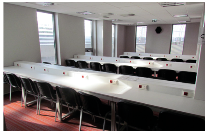
(exemple de zone de travail média équipée)

2- Photographies(s) d'une place permettant d'apprécier son équipement complet.