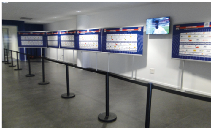
(exemple de zone mixte fixe habillée aux couleurs du club et chartée)

Pièces justificatives pour l'appréciation de la présence de la charte LFP : 3- Photographies de la charte mise en place pour la saison 2024/2025 ; 4- Dans la mesure où le club met pour la première fois en place ces éléments chartés : Projets de visuels pouvant être adressés jusqu'au 30 juin 2024.