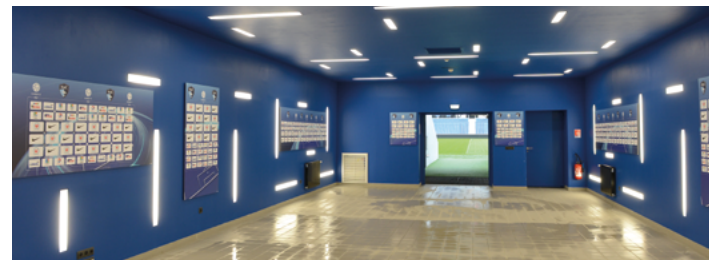
(exemple de zone d'attente des joueurs dont habillage club respectait la charte)

La zone d'attente joueurs doit être habillée avec la charte Ligue 1 Uber Eats, ou Ligue 2 BKT, afin que ce critère puisse être valorisé. Ne sont pas acceptés les habillages aux uniques couleurs du club qui ne seront pas chartés avec les éléments graphiques de la compétition.