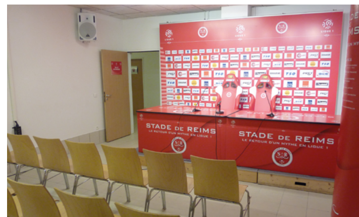
(exemple de salle de conférence de presse)