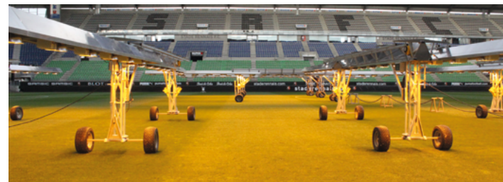
(exemple de dispositif de luminothérapie)

L'utilisation raisonnée de ce dispositif signifie une diminution au minimum de 10% d'apport de flux lumineux tout en conservant la densité végétale normative.