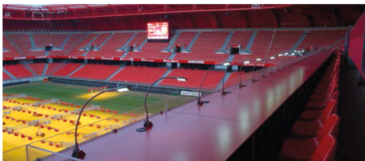
(exemple de places presse)