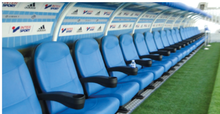
(exemple de banc composé de sièges de type fauteuil et rembourrés dont l'habillage respecte la charte)