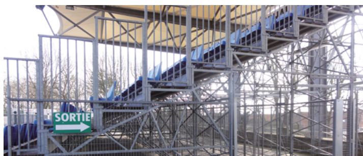
(exemple de tribune tubulaire)

Le barème s'applique quel que soit le nombre total de tribunes du stade.