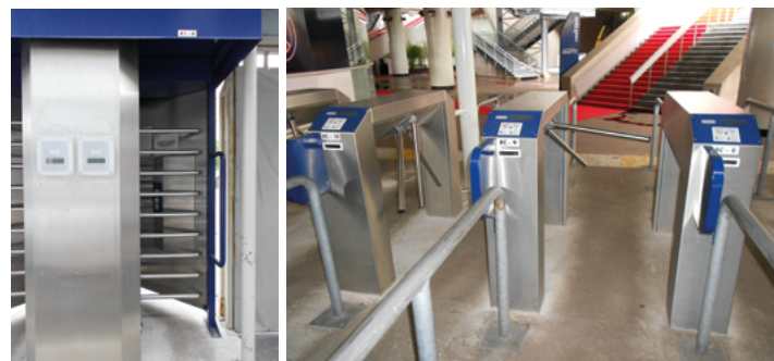
(exemples de tourniquets ou de hachoirs)

Contrôle sur place : La mise en place ou non d'un contrôle d'accès ainsi que la présence et le nombre de systèmes de corps contraignants doivent pouvoir être vérifiés en exploitation par les délégués de la LFP ou toute personne mandatée à cet effet par la LFP. Les caractéristiques du système ainsi que les types de titres d'accès lus par ce dernier doivent également pouvoir être appréciés.